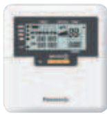
OPTIONELE BEDRADE AFSTANDBEDIENING CZ-RD514C